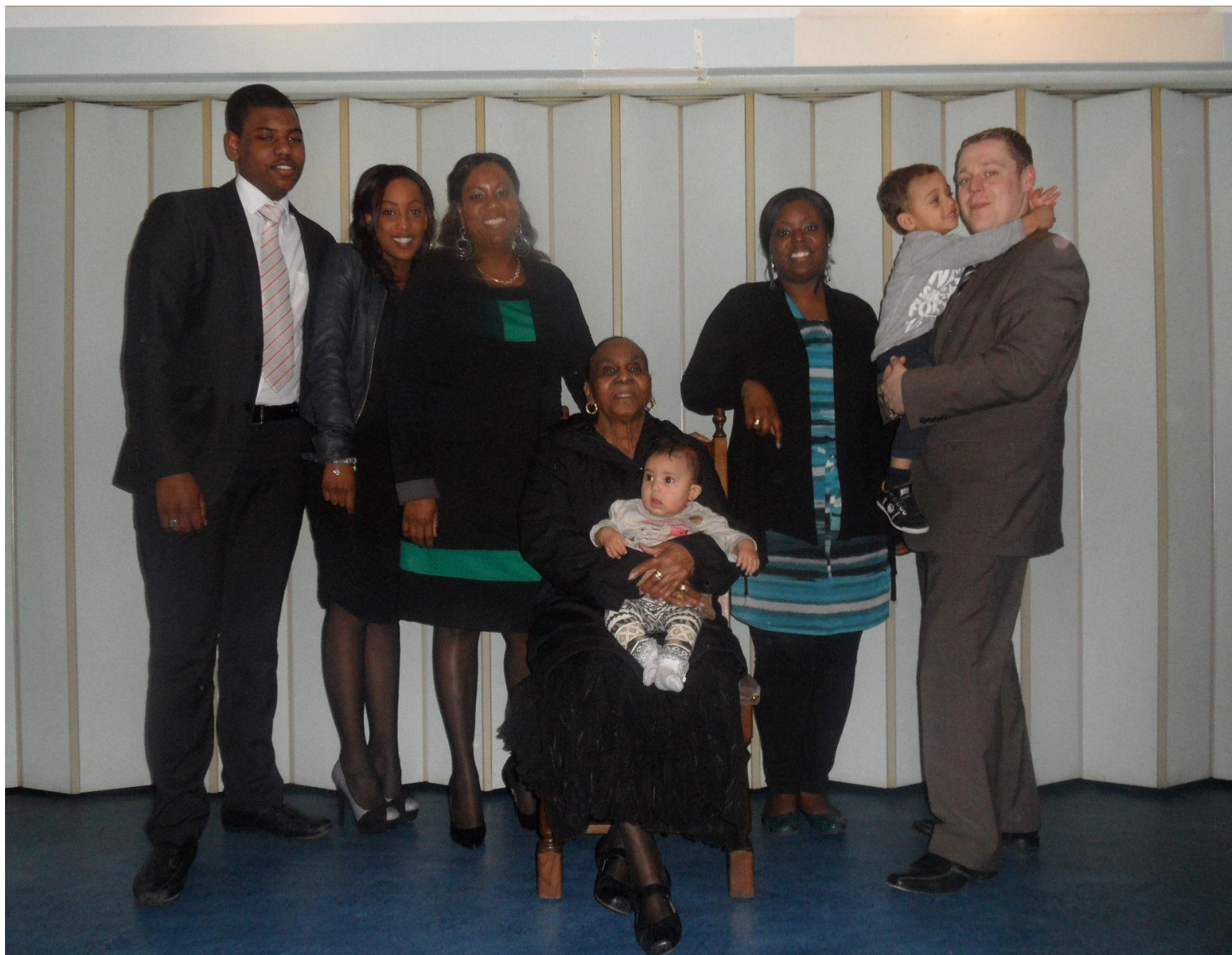
Dit zijn de vier generaties van fam. Cijntje & Opree