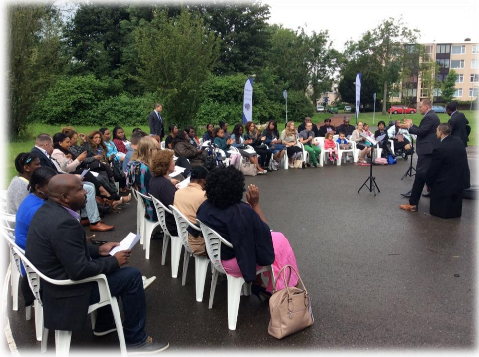
Een van de openluchtsamenkomsten naast het huidige kerkgebouw aan de Domela Nieuwenhuisweg 2 in Crabbehof.